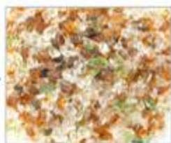
ガラスの粒(カレット)