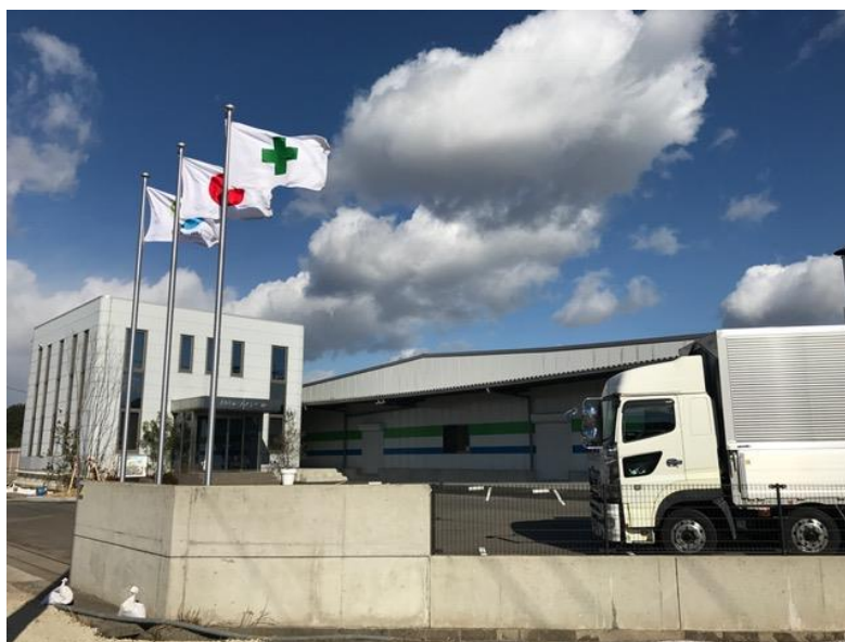
有限会社ランドベル 新岡山工場

有限会社ランドベルでは、これからの将来を担うお子様に向けて分かりやすい工場説明・環境説明を心がけています。ランドベルのリサイクル工場見学は、小学校や中学校・高校といった学生の皆さまの他、企業・商工会・青年部・地方自治体等の社会人の皆さまにもご好評頂いております。ランドベルのリサイクル工場見学を通じ、皆さまの環境を考える機会に役立てていただければ幸いです。